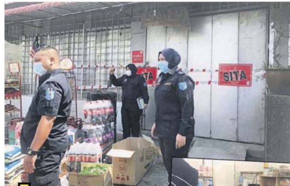
「封其中一间杂货店」 市议会在乌冷路查