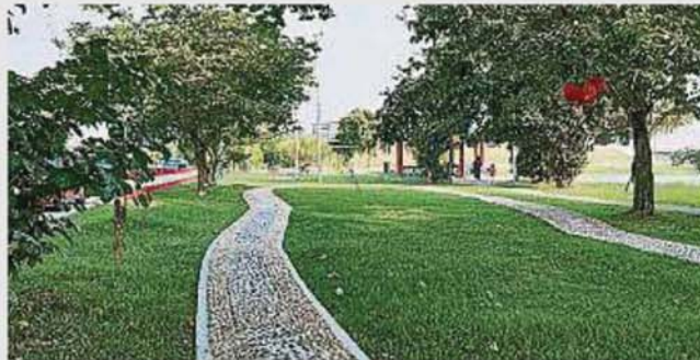
煥然一新的錫米山湖景公園郁郁葱葱，料會吸引不少民衆前來運動和休閒。

她指出，未開放之前，有民衆偷偷在公園里飲食、垂釣等，把垃圾留在地上，她希望民衆愛護公園環境。