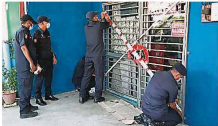
这家巴基斯坦外劳经营无牌理发店被检举后，执法人员进行查封。

要负责人是本地人，把商店交由外劳打理，又没有申请商业执照，当局不再放宽，所有被查封的商店，即使缴还罚款，若要重开做生意，先向当局申请执照。