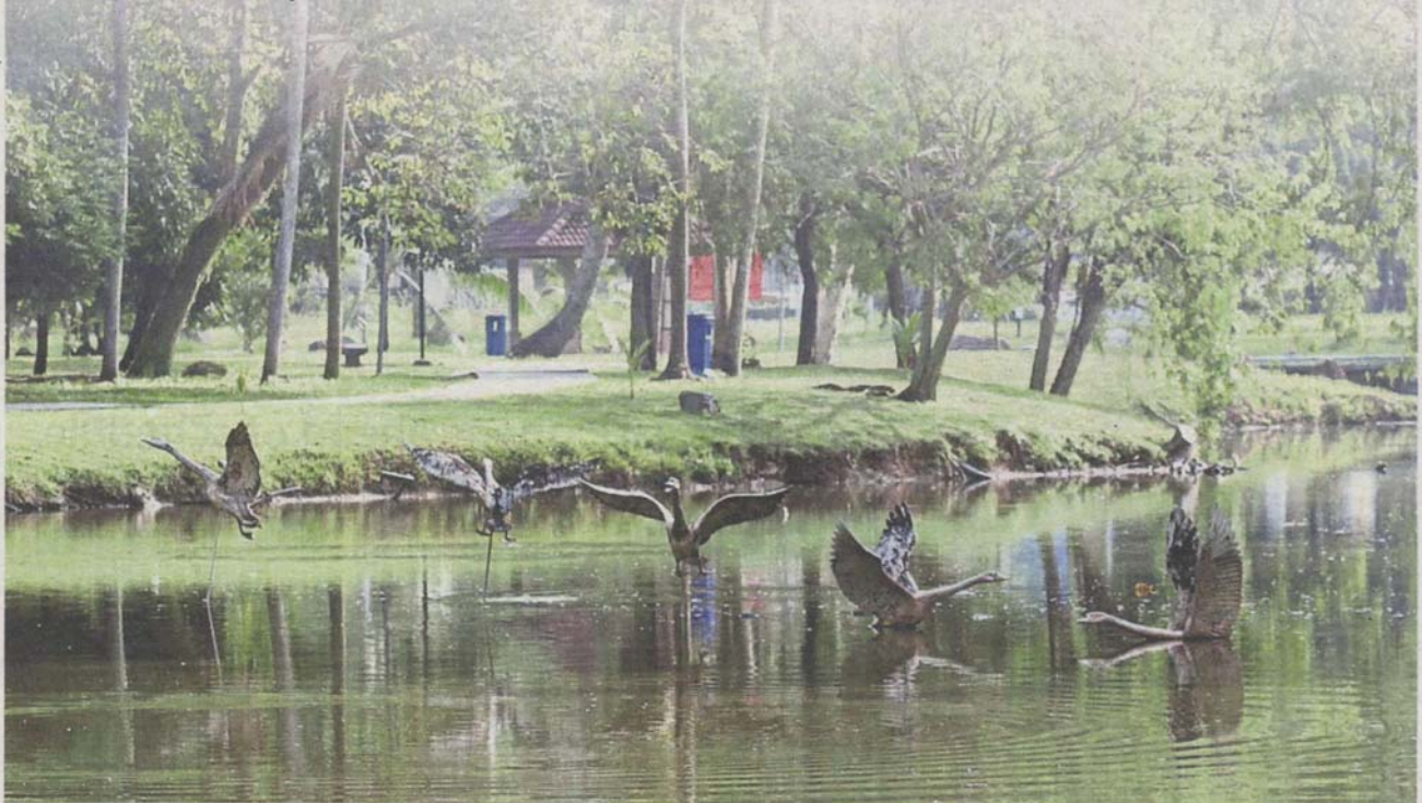
Damaged decorations: Sculptures of birds over the lake in Botanic Park have not been cleaned and are coated with mould.

Various residents associations in Bandar Botanic, Klang have teamed up with Klang Municipal Council to form a task force to address complaints and oversee maintenance of Botanic Park. >3