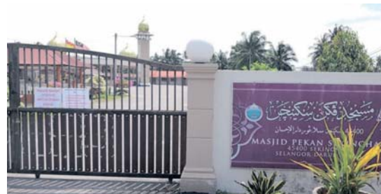
Masjid masih ditutup kepada orang awam dan dibenarkan dibuka semula pada 3 Julai dengan mematuhi SOP ditetapkan.

Sultan Selangor, Sultan Sharafuddin Idris Shah berkenan semua masjid dan surau yang diberi kebenaran menganjurkan solat Jumaat mendirikan solat itu berkuat kuasa 3 Julai ini.