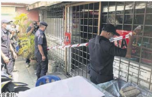
■这间杂货店被市议会查封。