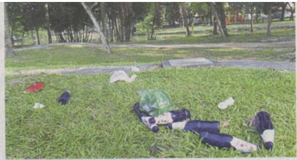
Empty liquor bottles and rubbish found in the park.