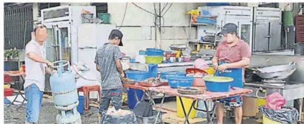
餐饮业者受促改善设施，切勿自辟“后巷厨房”，以免被取缔。

他今日联合巴生滨海小贩商业公会召开记者会时不忘提醒会员，一旦面对忽视禁烟法令消费者，业者有责任提出警告，一来作为维护其他消费者健康利益，二来