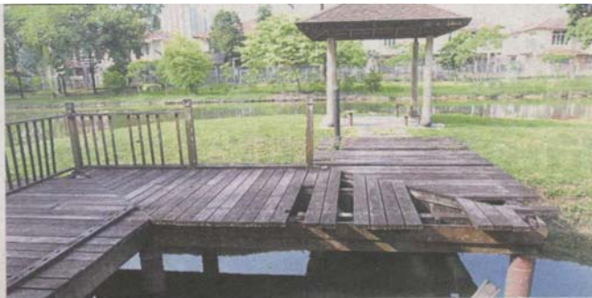
Broken wooden platforms at Botanic Park pose a danger to park-goers, especially children who may fall through the gaps.

Provided for client's internal research purposes only. May not be further copied, distributed, sold or published in any form without the prior consent of the copyright owner.