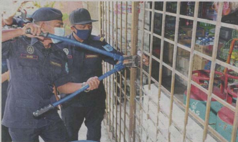
MPKJ enforcement officers breaking open the lock to a sundry shop that was operating without a valid business licence along Jalan Hulu Langat.

"We will also cooperate with other agencies like Immigration Department that can take action against those working illegally.