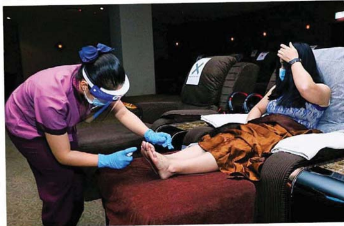
由于不能提供洗脚服务，所有客户在按摩前都会进行脚部消毒。

中央政府允许按摩及水疗业者在今日 (1 日) 复业，但地方政府的资讯却有出入，雪州一些业者即使有足够的技师，也不敢贸然在今日就复业。