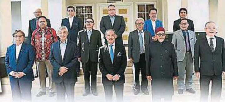
慕尤丁与国盟各党领袖召开会议时合影。前排左起为阿邦佐、阿末扎希、慕尤丁、哈迪阿旺及魏家祥。第二排右起为杰菲里吉丁岸、詹姆士、麦西慕、威尼斯瓦兰；第三排左起韩沙再努丁、阿兹敏、张庆信、沈桂贤及佐瑟古律。

（布城1日讯）首相兼土团党代主席丹斯里慕尤丁，今午与所有支持国盟（PN）的友党领袖会面。