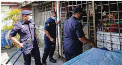
ANGGOTA penguat kuasa menggunakan alat pemotong untuk membuka kunci pagar kedai runcit.