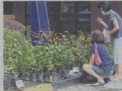
Visitors picking out their plants at the MBPJ sapling giveaway in Kelana Jaya.

Visitors were required to wear a face mask, sanitise their hands and register with the Selangkah system before entering the premises.